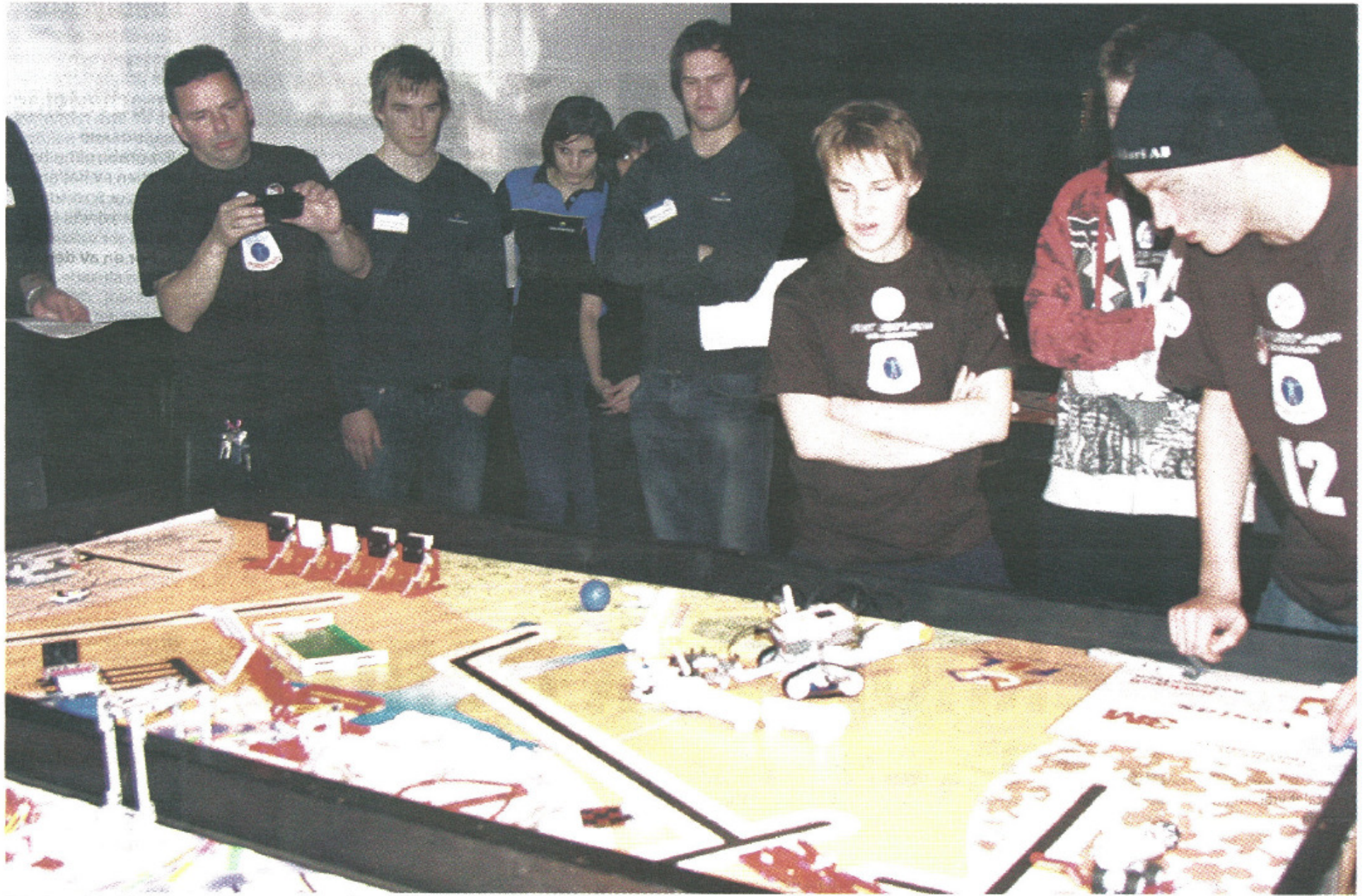
Nyhedens skola från Krokoms testkörde sin robot hårt innan tävlingen men hade ändå problem med att, i skarpt läge, få den att lyda.