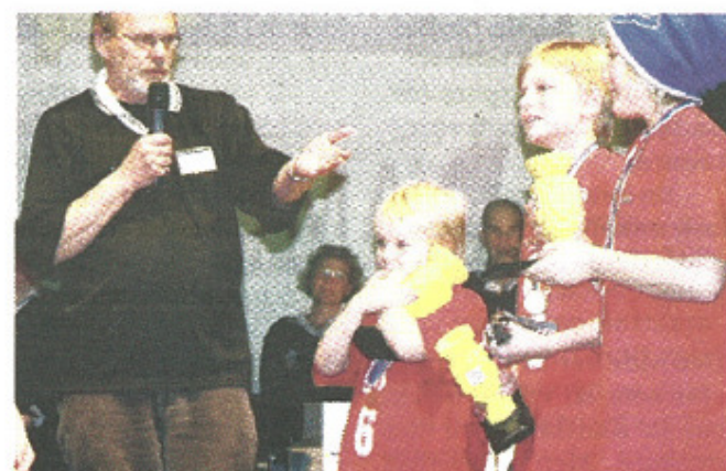
Segrande NXTeam från Sundsvall stormade scenen när deras namn utropades som vinnare. De får nu åka till Norge för att representera Norrland i den skandinaviska finalen i december.