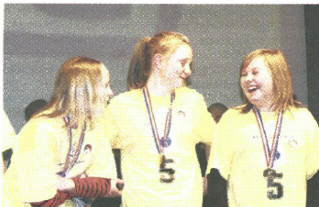
Trots att Härnösands-rivalerna Kastellskolan gick segrande ur robottävlingen var det inget fel på humöret hos Häggdånger skola.