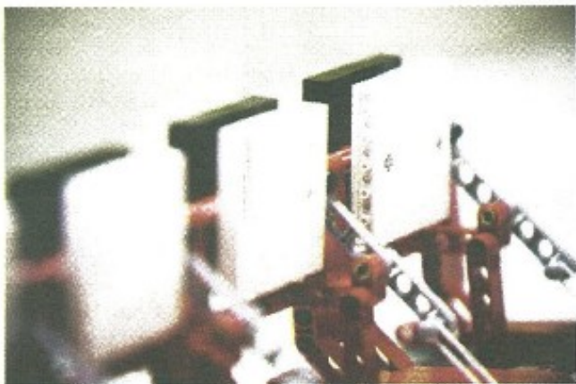
En makalös manick. Den som spanar in FLL-finalen i november får veta vad den är till för.