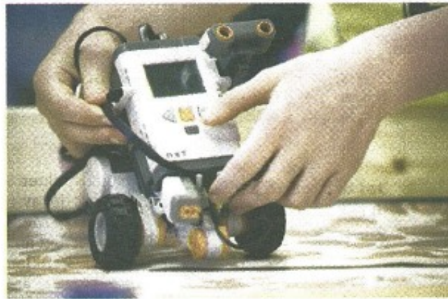
I november ska den vara klar för delfinalen i First lego league, som hålls på Technichus.